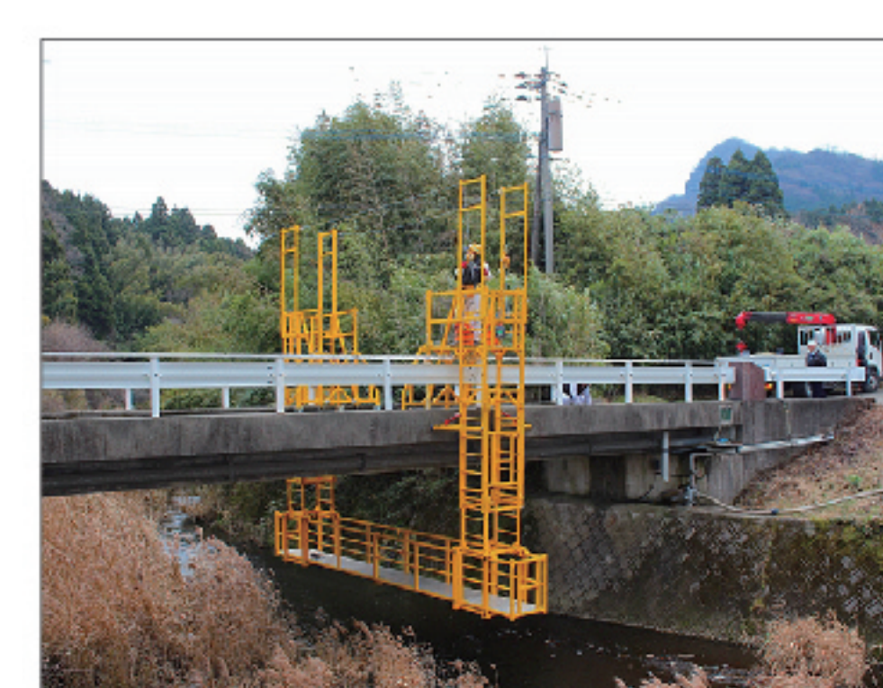
ブリッジハンガー