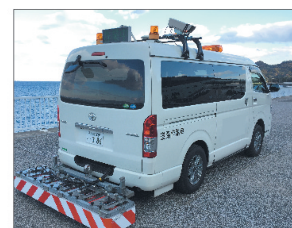
路面下空洞探査車