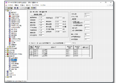
数量計算／数量データ