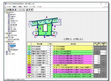
疲労計算／強度等級