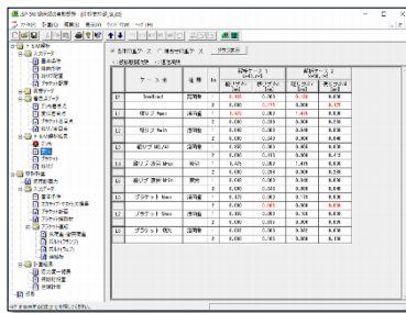
F S M解析／F S M解析結果ー変位