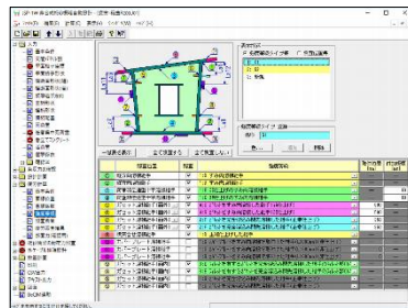
疲労計算/強度等級