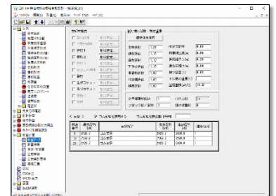
数量計算/数量データ